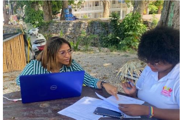
Aplicación del Instrumento Diagnóstico, por parte de los asesores, en las Mipymes beneficiarias del proyecto, durante el trimestre enero-marzo de 2024, en diferentes provincias del país.