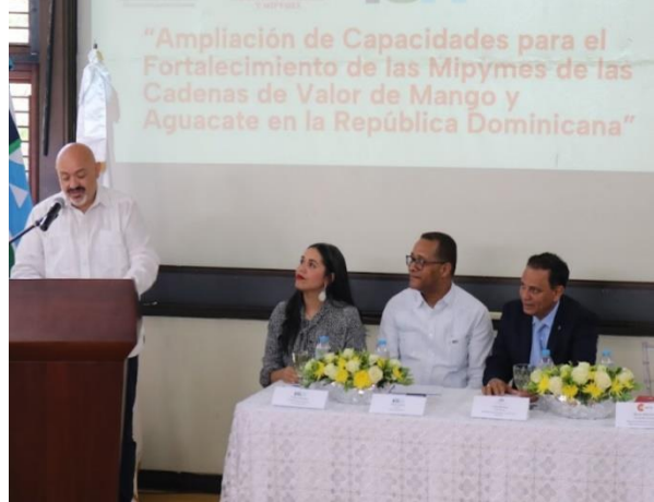
Participantes en el evento de lanzamiento del proyecto. Realizado el 20 de marzo de 2024, en horario de 10:00 a.m., en la Universidad ISA en Santiago.