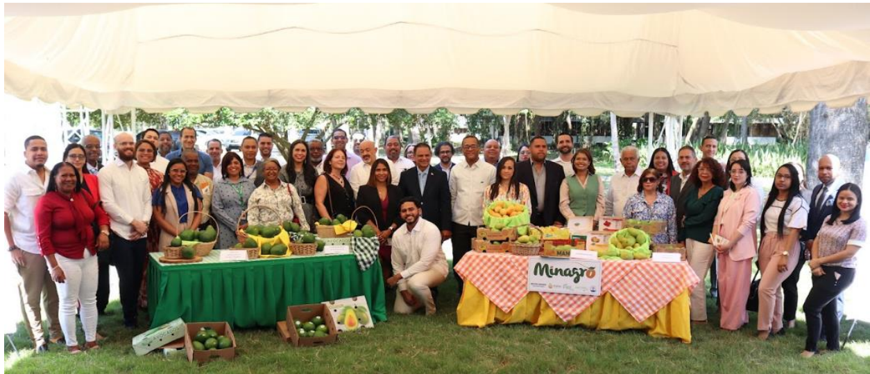
Participantes en el evento de lanzamiento del proyecto. Realizado el 20 de marzo de 2024, en horario de 10:00 a.m., en la Universidad ISA en Santiago.