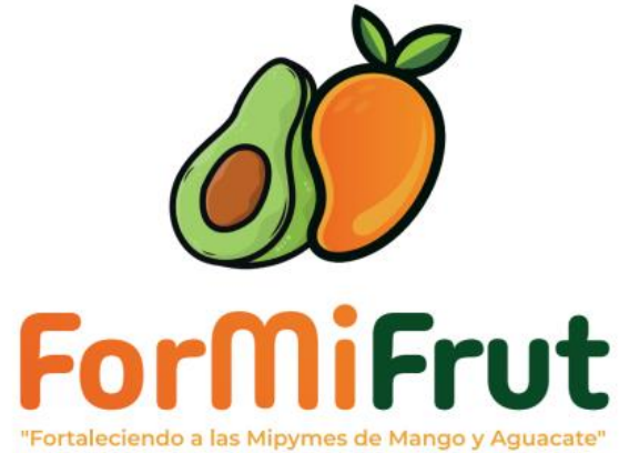
Identidad de marca creada para promocionar el proyecto.