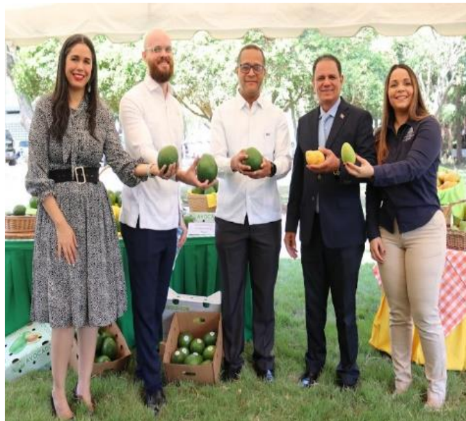
Participantes en el evento de lanzamiento del proyecto. Realizado el 20 de marzo de 2024, en horario de 10:00 a.m., en la Universidad ISA en Santiago.