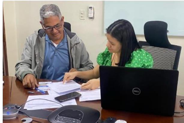
Aplicación del Instrumento Diagnóstico, por parte de los asesores, en las Mipymes beneficiarias del proyecto, durante el trimestre enero-marzo de 2024, en diferentes provincias del país.