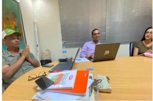
Aplicación del Instrumento Diagnóstico, por parte de los asesores, en las Mipymes beneficiarias del proyecto, durante el trimestre enero-marzo de 2024, en diferentes provincias del país.